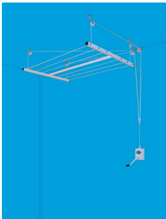
Tendedero el Sol