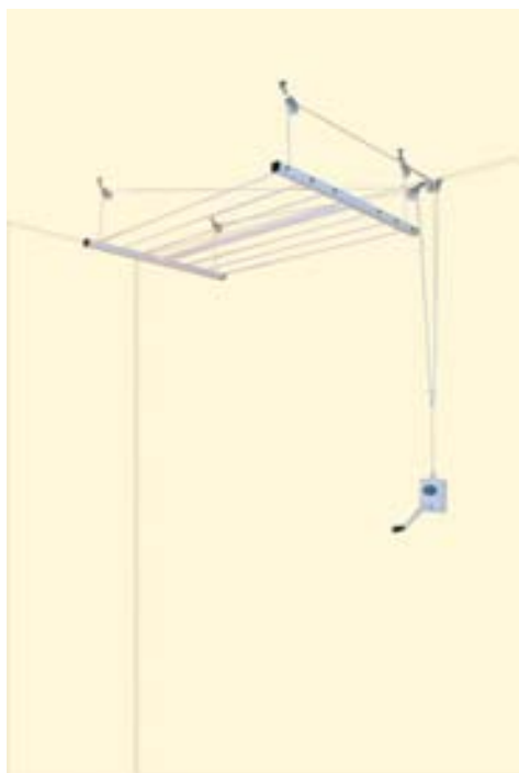
Tendedero el Sol