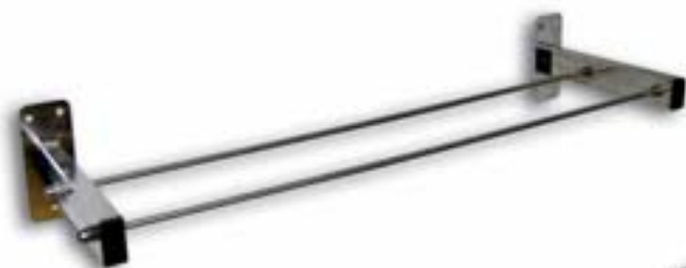
CÉSAR Modelo “ S ”. Longitud y Ancho Opcionales.

La calidad de los aceros inoxidables empleados para la fabricación de los tendederos de varillas fijas presenta una alta calificación y cumple las normas internacionales AISI 304 18/8, AENOR Z7CN18 - 09, BS 304S31 y SS 2332 - 02 . Los artículos de la gama César se pueden fabricar en diversas medidas: Longitud 75 - 100 - 120 - 140 cm. Anchura hasta 50 cm. Se debe tener precaución y evitar malas prácticas de limpieza que utilicen productos abrasivos que puedan afectar la superficie de uso.